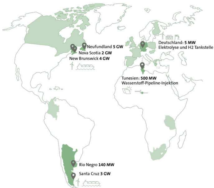
Abbildung 6: ABO Winds Wasserstoffprojektpipeline im Überblick